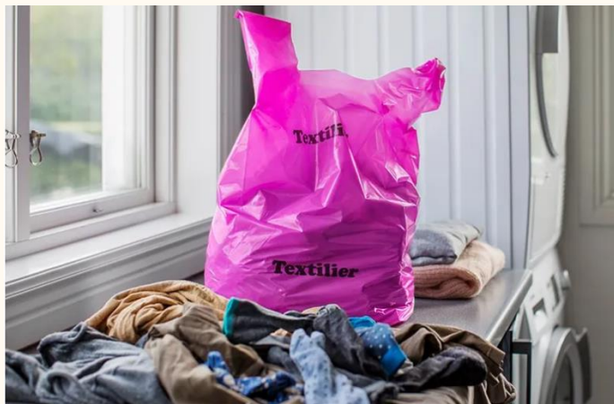
Sortera dina trasiga textilier i den rosa påsen